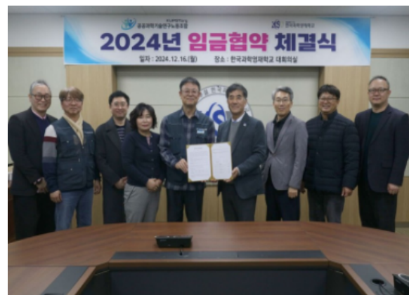
한국과학영재학교 임금협약 체결식 (12.16.)