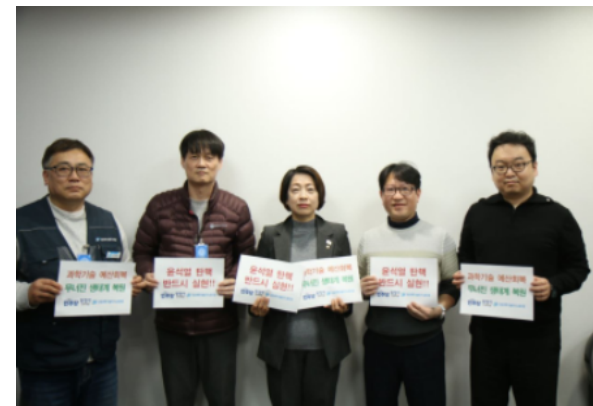
황정아 국회의원 간담회 (12.16.)