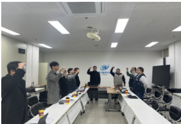
2024 - 4차 중앙집행위원회 (12.17.)