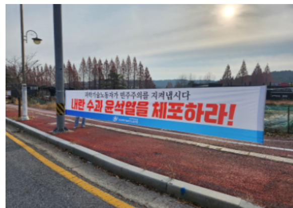
내란수괴 윤석열 체포 현수막 게시