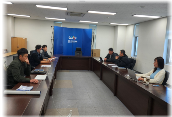
창원산업진흥원지부 단체교섭 (2. 26.)