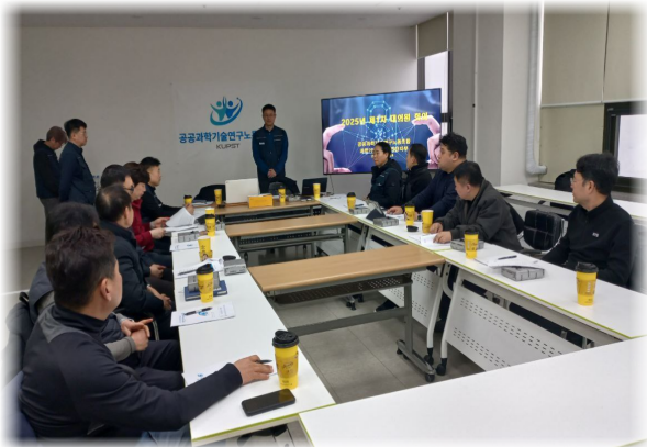
과학기술보안관리단지부 대의원회 (2. 24.)