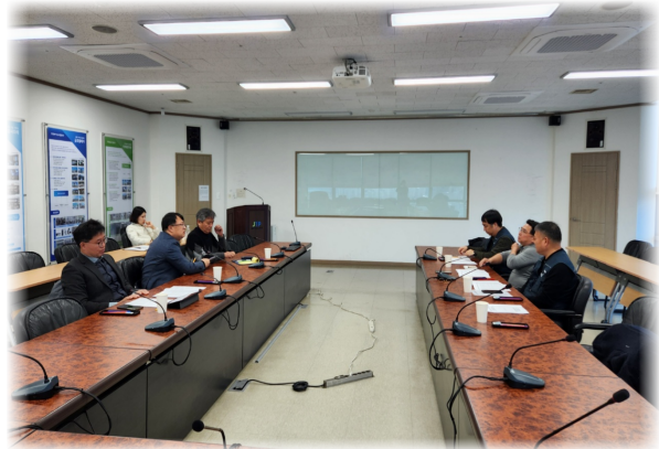
제주테크노파크지부 단체교섭(2. 25.)