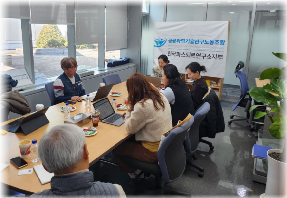
파스퇴르연구소지부 임원 워크숍 (2. 26.)