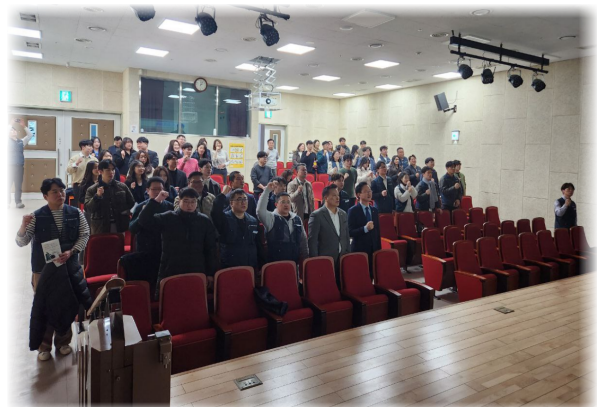
충북테크노파크지부 정기 총회 (2. 28.)