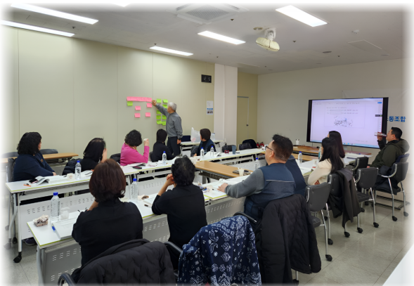
활동가 기초과정 10강 (2. 27.)