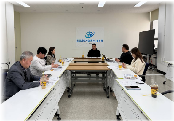
대동제 준비팀 회의 (3. 20.)