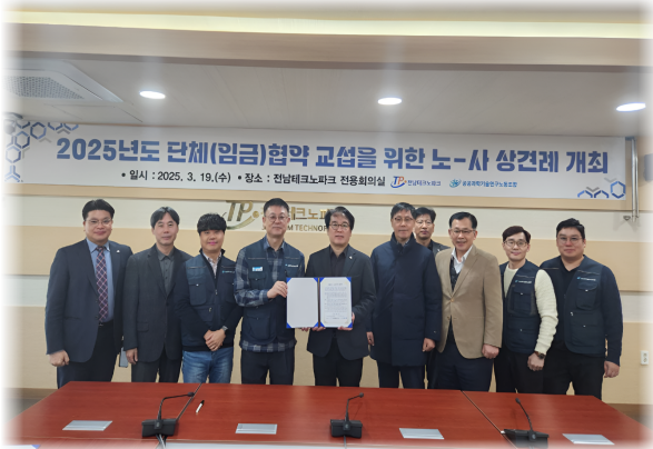
전남테크노파크지부 단체교섭 상견례 (3. 19.)