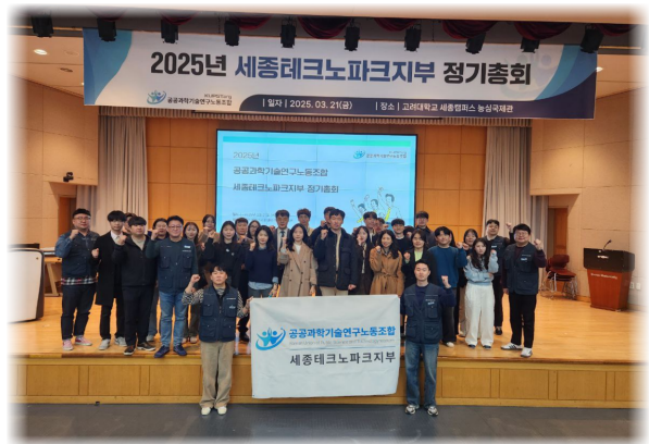
세종테크노파크지부 정기총회 (3. 21.)