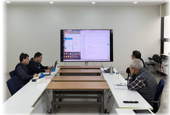
교안 작성위원회 워크숍(3. 20. - 21.)